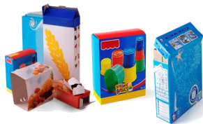
Les boîtes et suremballages en carton