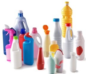
Les bouteilles et flacons en plastique « opaques »