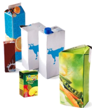
Les briques alimentaires