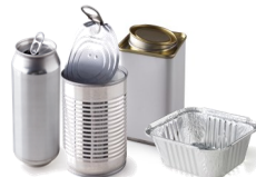
Les boîtes de conserve et barquettes en aluminium