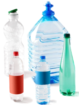
Les bouteilles en plastique transparent